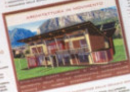
ARCHITETTURA IN MOVIMENTO